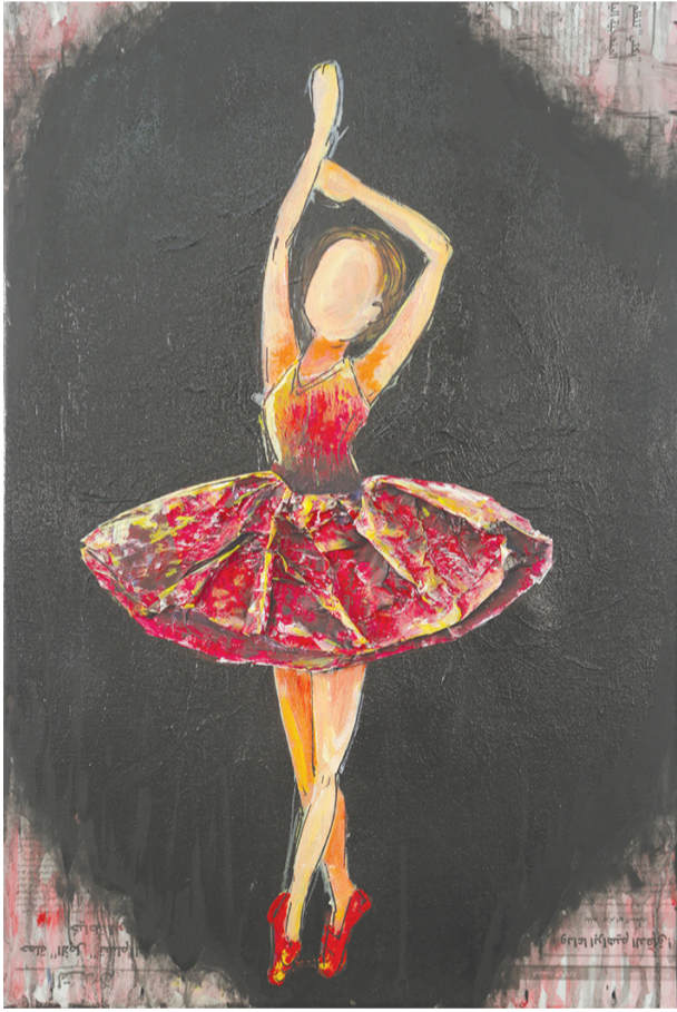
لوحة: سماح الجماسي

هنا كان ميلادي وهنا ستكون شهادتي على هذه الأرض الطاهرة على ترابها الطاهرة هنا في القلب حين لوطن في رنة صوته أين هنا تكلمت أضلعي عن ألامي التي لن تنتهي هنا قالت لي أمي حكايات عن أيام تقودنا لها الذكريات هنا نقشت أحلامي على صخرة من صخور بلادي