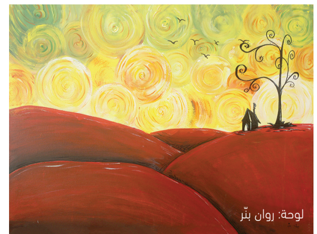
لوحة: روان بتر

توفي زوجي قبل أربع سنوات من الآن، أحببته، لم نجب أطفالا، أنا لم أتغير، مازلت أتناول الشطائر المحلة على الفطور وأكره الأعياد ومازلت أحبك، وهذه هي المرة الأولى مذ افترقنا وأنا أعبر عن هذا بكل هذه المباشرة، لا أخفيك شعوري بالخيانة حين تزوجت، لم أكن أدري تماقا من أخون، أنت، هو، وكنت كما العادة قد نسيت نفسي. لا بأس، فكرت يوما أن جزءة خفيّا منا لا يكف عن حب من أحبنا يوما، ذاك الجزء الذي سيحبهم للأبد. أعلم كم خسرت حين افترقنا، لا أو من أي عشق سابقا وربما سأعيش حياة أخرى أصح فيها ما اقترفت من أخطاء، كل ما أتمناه الآن هو أن تتذكرني وأنت تتذكر صباك وتبتسم وألا أكون أقل من هذا" بيطلع ع بالي إرجع أنا وإياك، إنتا حلالي إرجع أنا وإياك، أنا وإنتا ملا إنتا".